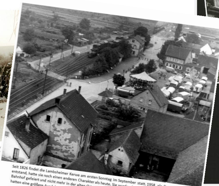
Seit 1826 findet die Lambsheimer Kerwe am ersten Sonntag im September statt. 1958, als dieses Foto entstand, hatte sie noch einen anderen Charakter als heute. Sie wurde aber bereits auf dem Platz vor dem Bahnhof gefeiert und nicht mehr in der alten Ortsmitte und in der Jahnstraße. Auch die Bahnanlagen hatten eine größere Ausdehnung.