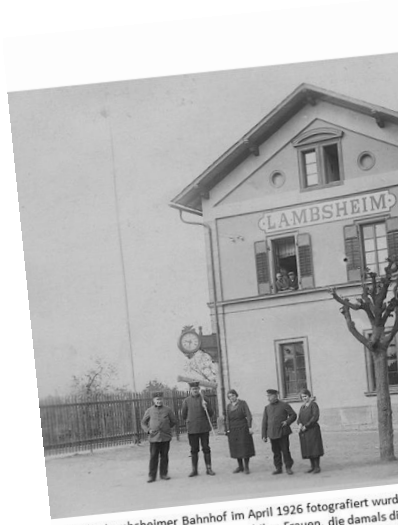
Als der Lambsheimer Bahnhof im April 1926 fotografiert wurde, stolz posieren die Eisenbahner und ihre Frauen, die damals die Gebäude bewohnten. Der Güterschuppen im Hintergrund verschwand.