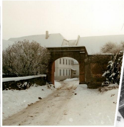
Die schneebedeckte Lambsheimer Mühle in den 1990er-Jahren. Im 15. Jahrhundert steht sie weit vor den Toren Lambsheims an. Die Mühle stammt aus den 1820er-Jahren. Im Jahr 1988 wurde der Mühlenbetrieb eingestellt.