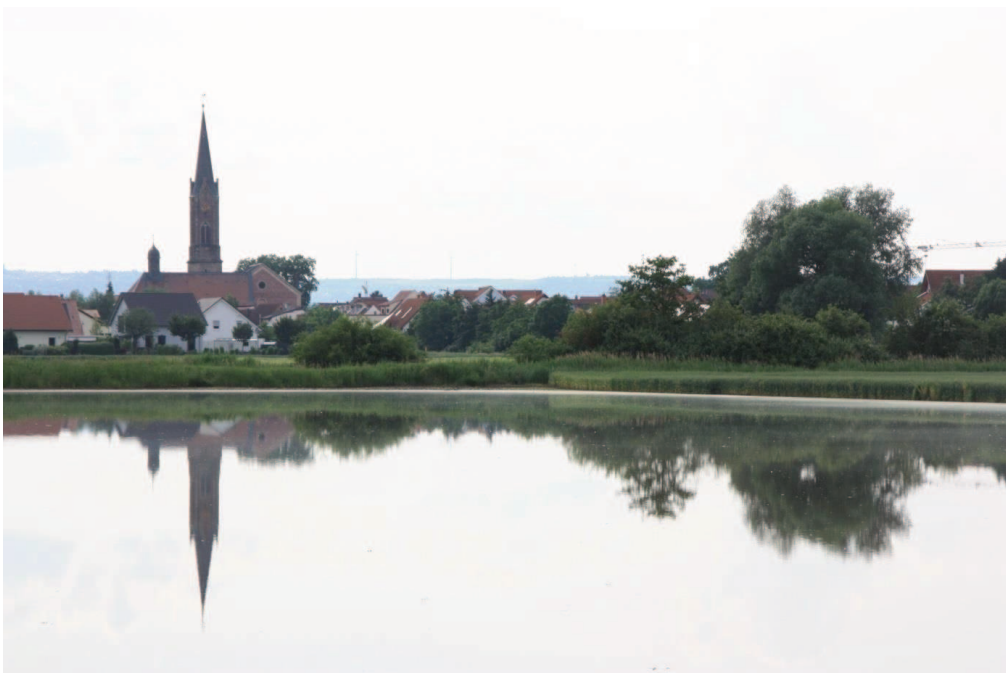
Abb. 1.4: „Lammundisheim am See“ aus dem Kalender der Lambsheimer Heimatfreunde, Mai 2017 [19]. Die Aufnahmen entstanden im Frühjahr 2016, nachdem starke Regenfälle zur Überschwemmung der Felder nördlich des Gewerbegebiets „Am Brand“ geführt hatten.

Sogenannte Jahrhunderthochwasser gab es auch schon früher [23], so das sog. Eishochwasser 1784 am Rhein und an mehreren anderen mitteleuropäischen Flüssen, beginnend am 27./28. Februar 1784 mit starkem Tauwetter und Eisauflauf nach einer Periode von ca. 70 Eistagen, wo auch der Rhein zugefroren war. Viele Brücken und Häuser wurden zerstört [23]. Im Bereich des Überschwemmungsgebiets längs des späteren Floßgrabens (Bereich verlandeter ehemaliger Rheinlauf) gab es auch gemeinsame, von Lambsheim koordinierte Aktivitäten mit den Anliegergemeinden. So trafen sich am 26.2.1726 die Abgeordneten von Fußgönheim, Dannstadt, Mutterstadt, Ruchheim, Hessheim, Beindersheim, Flomersheim, Eppstein, Lambsheim und Ormsheim in der Stadt Lambsheim (siehe Stadtratsbericht) wegen Vermeidung von Überschwemmungen durch Aufstauungen am Affengraben (Verbindung zwischen Floßbach und Altrheingraben bei Oggersheim) und man verlangte von Oggersheim ein Öffnen der Schleusen.