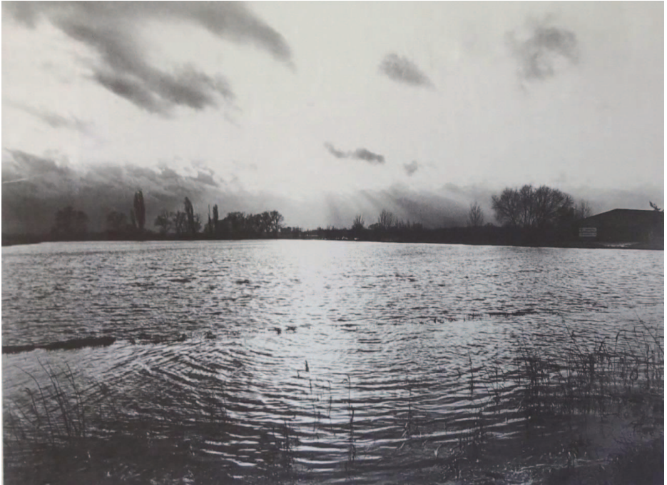
Abb. 1.3: „Landunter“: Bei der Flutkatastrophe vom 21. 12.1993 stand auch die Gewanne Holzacker südlich des Eppsteiner Wegs unter Wasser. Foto aus dem „Lamsheimer Bilderbogen“ (Geigerdruck 1996, Seite 72) [18]