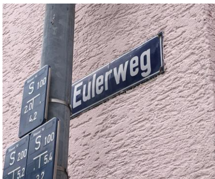
An der Ecke zur Ringstraße endete früher die Gewanne. Die Straße Eulerweg erinnert noch daran.

Diese Deutung würde der oben angeführten Negativdeutung von „Hunds...“ zudem diametral entgegenstehen.